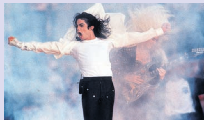
In this Feb. 1, 1993, file photo, Michael Jackson performs during the halftime show at the Super Bowl in Pasadena, Calif.

Around-the-clock King of Pop programming will begin at noon Eastern. Jackson joins SiriusXM channels devoted to artists like Bruce Springsteen, Frank Sinatra and The Beatles. Playlists created by singer Akon, Jackson's brothers and fellow Jackson 5 members Jackie, Marlon and Tito will also be featured. It will also include music that influenced